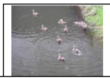
避難するカルガモ

《川の風景》 暑さで避難するカルガモたち と 久しぶりのモスクガニ発見 今年夏の異常な猛暑にさすがのカルガモたちも涼を求めて日陰に逃げていました。神明橋脇の道路下に避難したカルガモの写真を山本会員からいただきました。