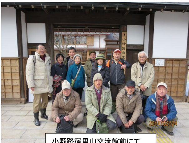
小野路宿里山交流館前にて

その後、残雪のある小道を下り、管理谷戸の一つである万松寺谷戸に出る。山林、雑木林、草地、田んぼ、沼地、畦道、小川が、まさに里山の景観。これから四季おりおりに、いろいろな美しい姿を見せてくれるだろう。そんなことを想像しながら、昼食予定の昨年出来た小野路宿里山交流館に向かう。ここで地元産のうどんを堪能。月曜日にも係わらず、中高年の方々が賑わっていた。環境保全と観光両立してほしいものだ。