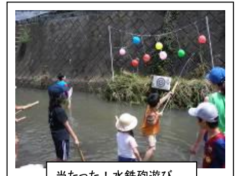
当たった! 水鉄砲遊び