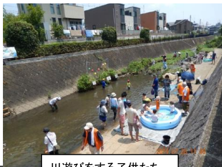
川遊びをする子供たち