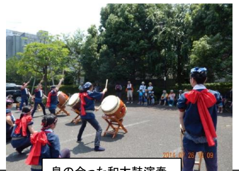
息の合った和太鼓演奏

した。網にかかったコイは大物で暴れて捕まえるのに一苦労。子供たちはその大きさに目を輝かせていました。見事な網さばきでした。