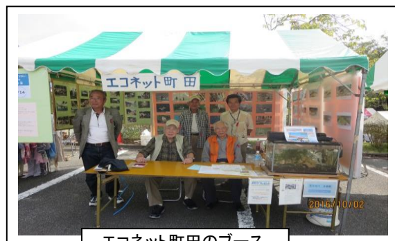
エコネット町田のブース