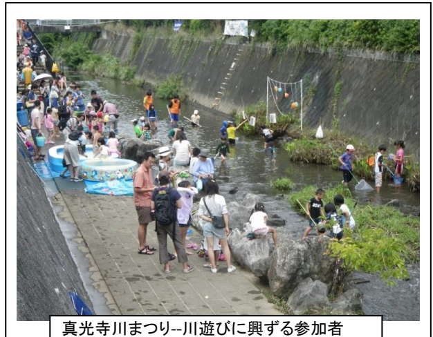
真光寺川まつり-川遊びに興ずる参加者

5 アオコが発生したり、大雨毎に広袴調整池の水が内周道路にあふれました。特に8月22日の台風9号では内周道路の上1m50cmまで水が上がりました。川の水は今年は少しキレイ