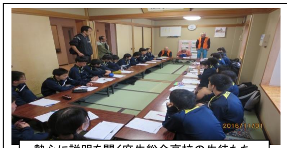
熱心に説明を聞く麻生総合高校の生徒たち