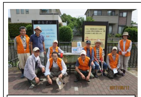
6月11日 下堰での集合写真(一部)

6月11日は曇り。12名が参加し16袋のゴミを拾いました。この日も下堰親水広場で真光寺川に住む魚たちを水槽にいれてミニ水族館を展示しました。通行人が立ち止まって興味深く見ていました。子どもたちもドジョウやエビなど、魚取りを楽しんでいました。