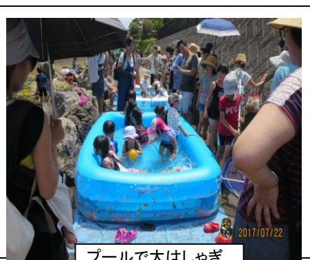
プールで大はしゃぎ