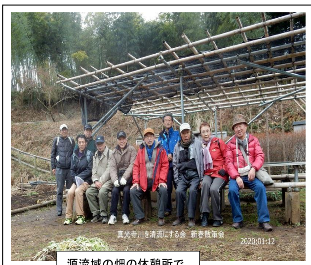
真光寺川を清流にする会 新春散策会 2020:01:12 源流域の畑の休憩所で

1 0時すぎ集合場所の真光寺のスーパー三和前を出発し、横浜ラーメン裏から地表に顔を出した真光寺川に沿って上流に向けて歩き始めました。数10メートル先の設備会社の裏手で布田道側の3つの源流からの流れと入谷戸川の流れがここで一つに合流するのを見ました。さらに真光寺交差点を進むと右手に飯守神