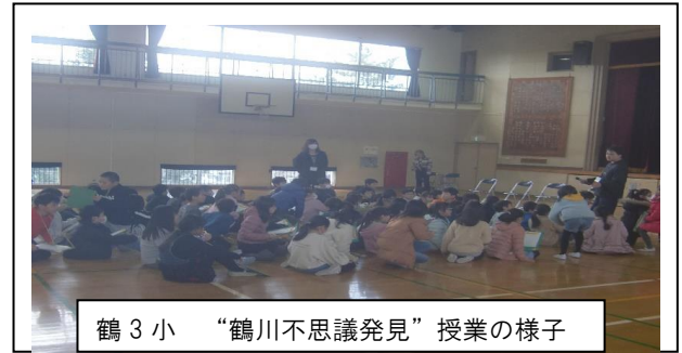
鶴3小 “鶴川不思議発見” 授業の様子

体育館の6ヶ所に各地域担当が陣取り、生徒達は12名が1班となり3スポットを廻り20分ずつ話を聞き、最後に全体で質問タイムを持つという段取りです。