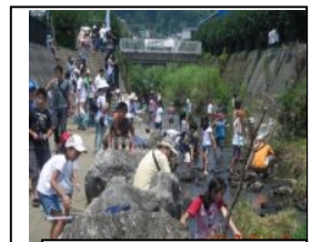
親子で楽しい魚獲り

7月28日暑い陽射しのもと第6回真光寺川まつりが行われました。魚獲り、水鉄砲、シュロの葉のバッタ作りなど色々な遊びに沢山の子供たちが参加、用意した200本の冷たいジュースも不足気味の大盛況。また投網のデモンストラーション、鶴三小のしおり販売、和光鶴小の版画便箋の販売など子供たちも積極的にまつりを盛り上げてくれました。さらに和光学園の父兄の勇壮な桶太鼓演奏、真光寺川ウォーキング、長蛇の列となったメダカの子供プレゼントなど真光寺川はときならぬ子供達の歓声に沸き立った1日でした。