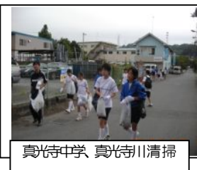
真光寺中学、真光寺川清掃

私たちは真光寺川を清流によみがえらせ、生き物が戻り楽しい遊び場になることを願って自然環境の学習支援活動を行ってきました。鶴三小や和光鶴小が真光寺川やゴミについて学習し、その成果を「HATSのつどい」で発表・展示を行ってくれました。そのほか9月真光寺中学1年生全員が当会のボランティア活動について学習するとともに川沿いの道の清掃を行いました。また10月には麻生総合高校1年生15名が当会の概要と真光寺川の生き物について学習し、その後川の清掃を行いました。