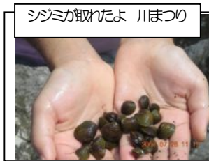
シジミが取れたよ 川まつり

昨年は鳥に食べ散らかされたシジミの貝殻をあちこちで見られるようになり、真光寺川まつりでは子供がシジミを沢山とって見せてくれました。地元の古老からは昔はたくさんいたよとのお話。水質が改善し真光寺川の生物がまた一つよみがえりました。しかし神奈川県内水面試験場の判定では台湾ンシジミとの認定。古老の話すシジミはマシジミと思われませんが、繁殖力の強い台湾ンシジミに全て置き換わったとのこと。そのほか昨年新たに源流域でサワガニが沢山生息しているのを確認しています。またシマドジョウの生息情報やモクズガニの抜け殻発見情報が寄せられていますが未確認です。真光寺川の生き物について情報をお持ちの方はぜひお知らせ下さい。