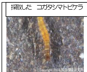
採取した コガタシマトビケラ

和光鶴小4年2組(松井教諭)が総合学習で真光寺川を勉強していますが、その一環で11月25日、下堰親水の下流部で全国水生生物調査の正規マニュアルに則って水生生物の採集を実施しました。この調査で指標生物のコガタシマトビケラ30匹、ヒル3匹、アメリカザリガニ4匹を採集、神奈川県内水面試験場で確認してもらったところ水質階級Ⅱに該当するとの判定を得ました。(コガタシマトビケラがキメテ)。全国水生生物調査では採集された指標生物によって川の汚れの程度をⅠきれいな水、Ⅱ少し汚れた水、Ⅲ汚れた水、Ⅳ大変汚れた水の4階級に分類しており、