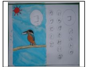
真光寺川俳句カルタ

3月18・19日、第5回まちだ市民大学「HATSのつどい 2007」が開催され、日頃の取り組みをパネルに展示するとともに、真光寺川に生息する魚と野鳥について発表を行いました。また真光寺川をテーマに学んだ和光鶴小4年1組が学習の成果を発表し、作成した墨絵の鳥獣絵巻物や真光寺川俳句カルタを展示してくれました。またゴミ問題について学んだ鶴三小4年生はゴミのリサイクルについて学習の成果を展示してくれました。いずれも小学生らしい生き生きとした感性で真光寺川やゴミ問題に取り組み、私たちにうれしい励ましとなりました。