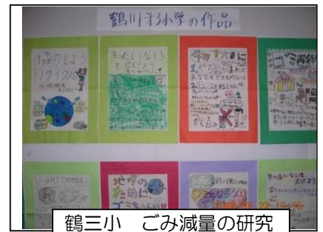
鶴三小 ごみ減量の研究