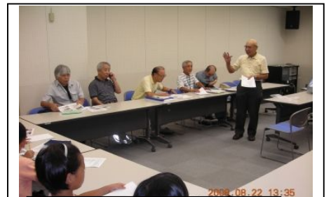
質問に答える会のメンバー

田川の魚、鳥」「滝ノ沢周辺の湧水」「レジ袋削減活動」についての発表がありました。