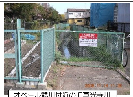
オバール鶴川付近の旧真光寺川

こ の地図によると改修前の真光寺川は、神明橋付近から蛇行しながらほぼ現在の川に沿って流れ、能ヶ谷橋付近で鶴川街道に近接し、下堰親水の三角地や駐車場を蛇行し、能ヶ谷いこい会館の前を通り、鶴川駅東口交差点の歩道橋の脇から津久井道にかけていた旧矢崎橋に流れています（旧矢崎橋の一部が今も残る）。その流れはさらに津久井道沿いの鈴木商店の裏からマンション「ルピナス鶴川サウスステージ」の前を通り、現在の川に入り小田急線の下を