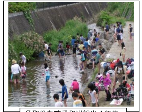
魚取りをする和光鶴小4年生

5月13日、和光鶴小の4年生71名が大野先生他3人の先生に引率され父兄2人と共に真光寺川学習の第1回目として下堰親水を訪れました。車椅子で参加した仲間も2人いました。今回は真光寺川がどんな所かと川に慣れるのが目的のようです。清流にする会からは3名が参加、山岡さんが魚の話をしていました。子供たちは大喜びで川に入り、オイカワ、ヨシノボリ、ザリガニ、カメなどを捕まえていました。今年は4年生全員が真光寺川学習に取り組むようです。（山本 隆治記）