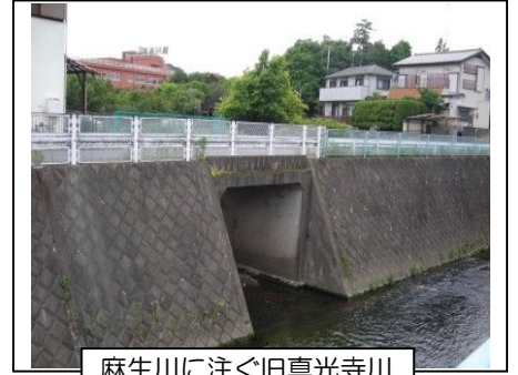
麻生川に注ぐ旧真光寺川

流れて、川内橋の上流左岸のマンション「オバール鶴川」2号棟の南で今の川筋から東へ離れていきます。流れはさらに三輪のテニスクラブ裏、川崎市麻生環境センターの緑の広場の南縁を通り、鶴川高等学校の裏を通って麻生川に注いでいます。